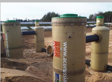
Индустриальный парк "Великий камень" "Оборудование для очистки поверхностного стока в составе ЛОС накопительного типа с самым большим в мире безбетонным аккумулирующим резервуаром АСО StormBrixx, Минск, Республика Беларусь